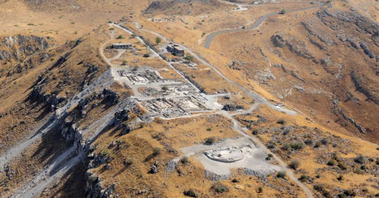
סוסיטא. תצלום אוויר. צולם מיד עם סיומה של העונה ה-11 ביולי 2010. מבט ממערב.