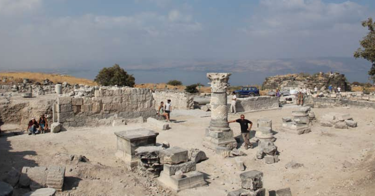
חלקה הדרומי של הבסיליקה כפי שנחשף בתום העונה ה-11 ביולי 2010. מבט לכיוון דרום