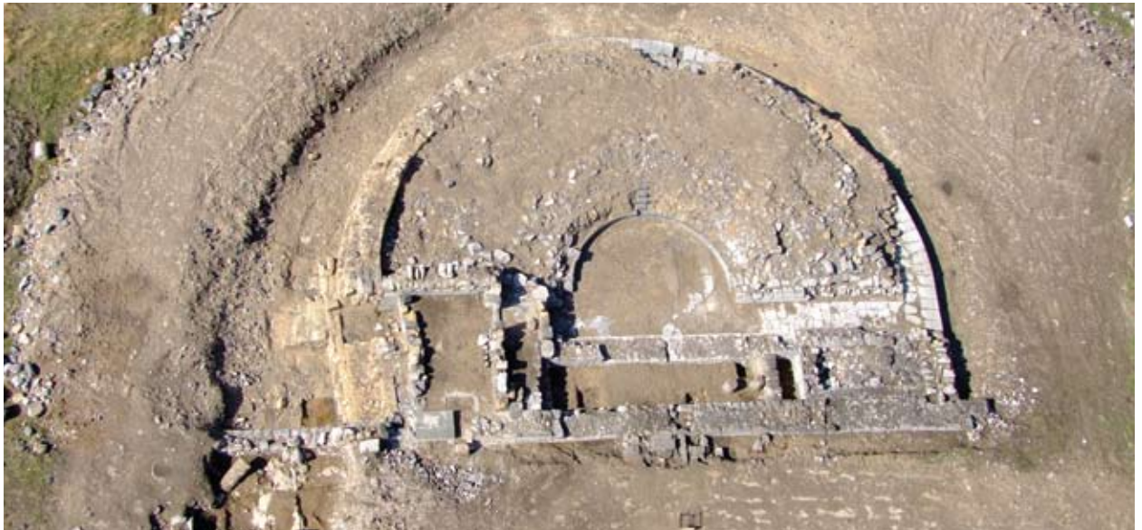
האודיאון, תצלום אוויר

שמו היווני של מתקן שעשועים זה – שמקורו במילה אודה (ode) שפירושה שיר – עלול לבלבל, שהרי האודאון