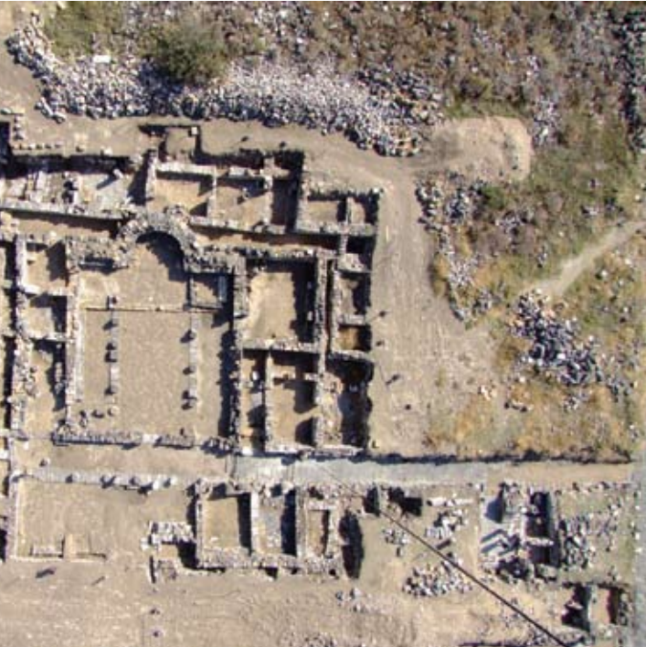
הכנסייה הצפון-מזרחית (נחפרה על ידי המשלחת האמריקאית). תצלום אוויר (SkyView Photography Ltd).

חקלאיים, כגון שלוש גתות ובית בד. הכנסייה הוקמה מאבני הבנייה של המבנים הקדומים מהתקופות ההלניסטית והרומית. לאולם התפילה, שציר האורך שלו מזרח-מערב, מתאר מלבני, ושתי שורות עמודים מחלקות אותו לאולם תווך ולשתי סיטראות. במרכז הקיר הקצר המזרחי נמצא האפסיס (גומחה חצי עגולה, המקורה בחצי כיפה), ואילו ממערב לאולם התפילה משתרעת רחבה קטורה (אטריום), המרוצפת לוחות אבן מבזלת. לעומת זאת אולם התפילה רוצף כולו פסיפס נאה, ששולבו בו שתי כתובות יווניות קצרות ובהן שמות הנדבנים.