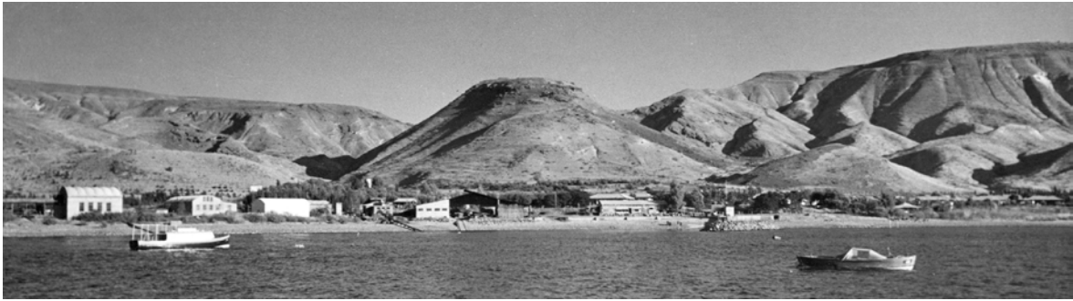
איור 2: הר סוסיתא. מבט מהכנרת (1945, ארכיון קיבוץ עין־גב).