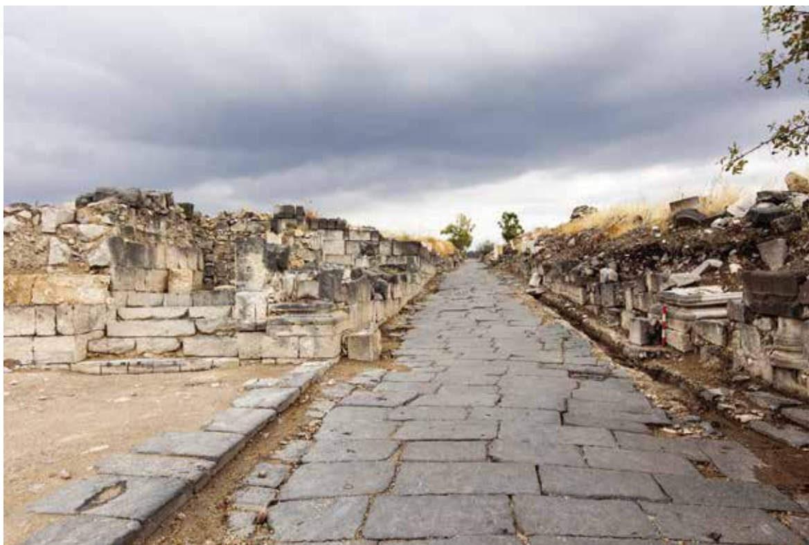
איור 5: הדקומנוס מקסימוס המזרחי, צילום מן הפורום לכיוון מזרח. תנו דעתכם לשני בסיסי האומנה בקדמת התצלום עבור הקשת הדקורטיבית שנבנתה ממזרח לפורום.

המרחץ, הסמוך לחומה הדרומית של העיר. על פני השטח מבצבצים קטעי קירות איתנים, המעידים שבין הפורום לבין בית המרחץ התנשא מבנה ציבור גדול. הואיל ואזור זה של העיר טרם נחפר, אין לדעת מהו המבנה הזה.