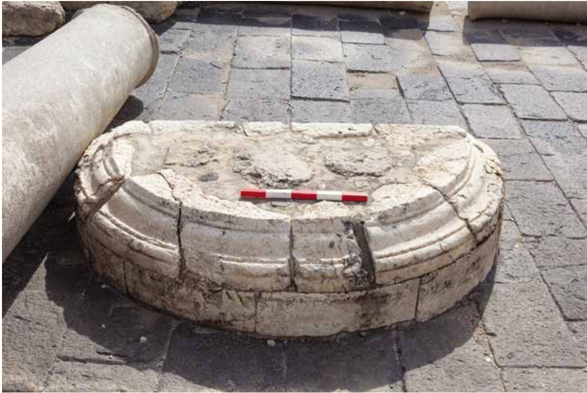
איור 7: מסד חצי עגול עבור פסל או מונומנט שהוצב בצידו הצפוני של הפורום.