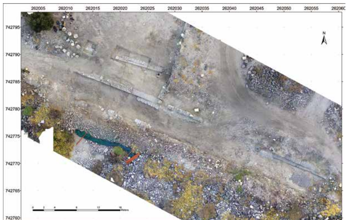
איור 4: תצלום מיושר של קטע מן הרחבה והדקומנוס מקסימוס המערבי, מדרום לאודיאון.

הדרך היורדת אל חוף הכנרת (איזנברג 2017: איור 6). שער זה ממוקם בקצהו המערבי של הדקומנוס מקסימוס, השתמרותו גרועה והוא עדיין לא נחפר. השער המזרחי, הנמצא בקצהו המזרחי של הדקומנוס מקסימוס, נחפר, ועל אף השתמרותו החלקית אפשר לשחזר את תוכניתו. לשער היה מעבר אחד ברובו 3.20 מ'. משני צידי החזית המזרחית של השער היו מגדלים. מזה הצפוני, שהיה ריבועי במתארו, לא נותר כמעט דבר, ואילו מהמגדל הדרומי, שהיה עגול, שרדו הנדבכים התחתונים המאפשרים לשחזרו. המגדל הדרומי שולב בחומת העיר ויצר עימה מערך הגנה ששלט היטב על הכניסה לעיר מצד מזרח. קוטרו החיצוני של המגדל היה כ־8 מ', וסביר להניח שבמקורו התנשא לגובה של שלוש קומות. הוא הצטיין בבנייתו האיתנה והאיכותית באבני גזית מבזלת המסותתות היטב. על סמך הניתוח הטיפולוגי של שרידי השער ועל סמך ההשוואה לשערי העיר בטבריה ובגדרה הסמוכות,