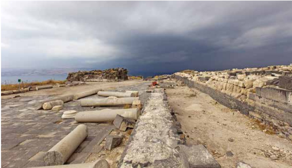
איור 6: רחבת הפורום והקליבה ברקע. תנו דעתכם לעמודי הגרניט שנפלו מהקיר הנושא ברעש האדמה של שנת 749. מבט לכיוון מערב.

של ערים כמו גדרה, גרש, בצרה או פטרה מורה בבירור, שאף על פי שכל אחת מהן הוקמה בתנאים טופוגרפיים שונים, כולן מאופיינות בתוכנית עיר שעיקרה ציר תנועה מרכזי אחד. בין ערי הדקפוליס גדרה היא הקרובה ביותר לסוסיטא בתוכניתה העירונית (Weber 2002), שכן אף היא בנויה לאורך רצועת קרקע מלבנית במתארה, התחומה בצידה האחד במצוקים. גם בגדרה רוב בנייני הציבור הוקמו לאורך דקומנוס מקסימוס, שאורכו 1,459 מ'. רחוב זה רוצף בקפידה ועוצב כרחוב עמודים מרשים.