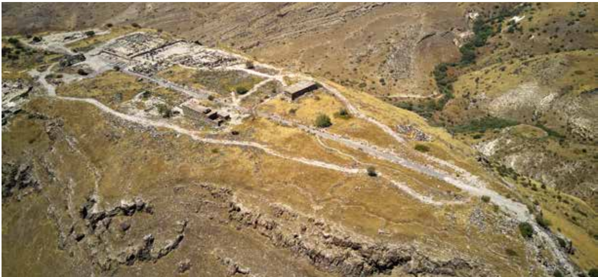
איור 3: תצלום אוויר של רמת הר סוסיתא לכיוון צפון (2017).